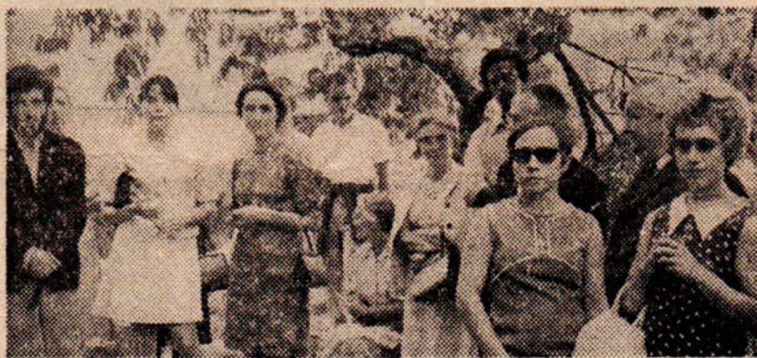
Les visiteurs sur le chantier

C'était ensuite la visite à Notz-l'Abbé où, dans la chapelle, propriété de M. Soubrier, sont exposées les plus curieuses découvertes faites à Saint-Romain, en attendant que la commune soit à même de fournir une salle d'exposition.